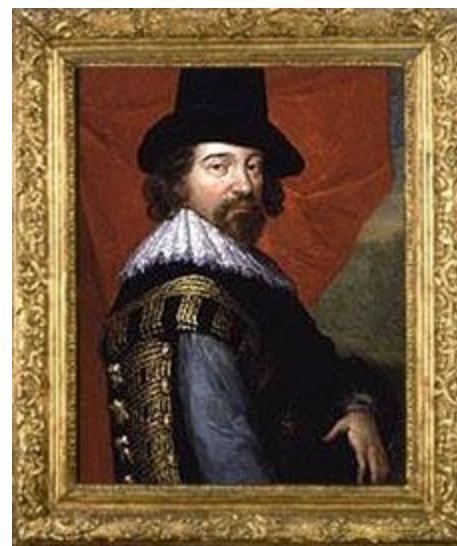
Sir Francis Bacon (1561-1626)

Hevn er en form for vill justis. Vi er inne i en ønsker hevn i mer bekymringsfull utvikling nødvendig er det med et hvor media stadig påpeker lovverk som regulerer hevn og strengere straffer og får med seg folket. Nå har vi politikere som vil tekkes folket.